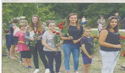
La génération montante rend hommage aux disparus.