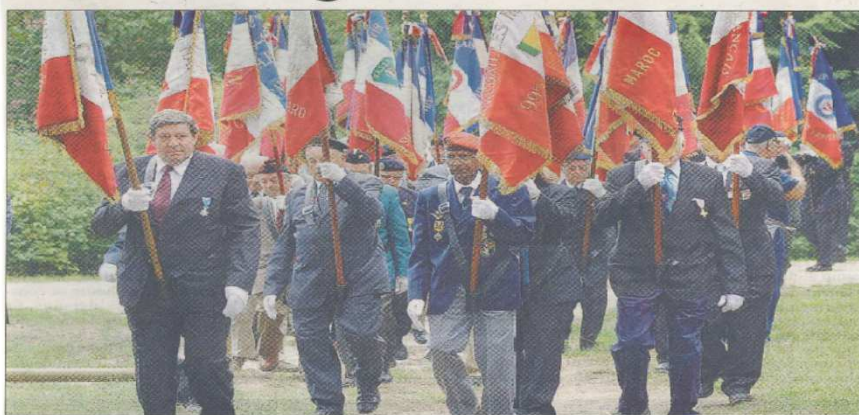
Les porte-drapeaux en tête du cortège.