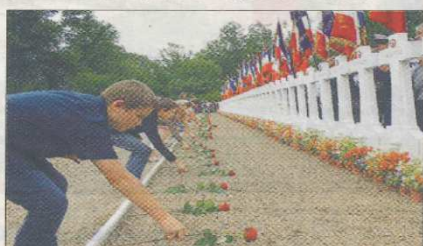
À chaque sépulture sa rose.